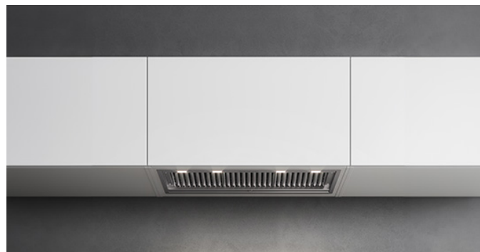
Снимката е само за информация Може да не отговаря на избрания модел

Тип монтаж Вградени аспиратори Размери 90 cm Финишинг Неръждаема стомана Scotch brite (AISI 304) Мотор 800 m 3 /h Тип управление Електронно управление Степени на мощност 4 Осветление Светодиодно осветление: Led 4x1,2 W - 2700 K / 5600 K Филтър с активен въглен Round charcoal filter Ø170 mm - Type 6 (включено в комплекта) Минимално разстояние Газов котлон: 62 cm Електрически котлон: 52 cm